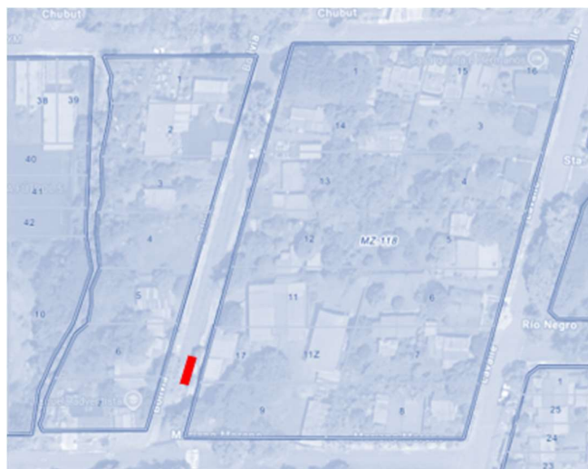
Ubicación del estacionamiento de motos